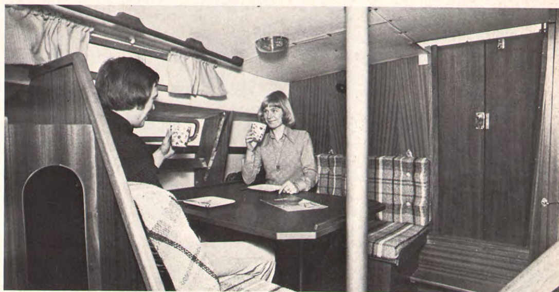
På kryds gennem små krappe søer føles Albin 82 MS som en sejlbåd. Man kan styre enten med rovpinden eller med rattet ved førersædet. Fokken er selvskødende på sin løjboom. Herover ses dinette-arrangementet. Mastestøtten står midt i kabytten.